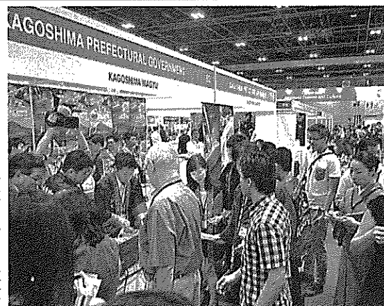
多くの来場者でにぎわう鹿児島県のブース=18日、シンガポール

経済産業省は21日、新規参入した電力小売り会社が、既存の送電網を利用する際に電力会社に支払っている料金について、現行の「届け出制」から、国が適正かどうかを厳格に審査する「認可制」に変更する方針を決めた。電力小売りを全面自由化する2016年をめぐりに実行する。 一定する電気事業法改正案に盛り込む。新制度は、利用料を値上げする際は国の認可とする。一方、値下げの場合はより素早く実施できるように届け出制のままとする。 この日の作業部会では、大手電力会社に対する顧客の利用情報を、新規参入の電力小売りに開示することを義務付ける方針も示された。大手と新規参入会社が公平に競争できる環境を整え、値下げやサービスの多様化につなげるのが狙い。 この日の作業部会では、大手電力会社に対して、顧客の利用情報を、新規参入の電力小売りに開示することを義務付ける方針も示された。大手と新規参入会社が公平に競争できる環境を整え、値下げやサービスの多様化につなげるのが狙い。